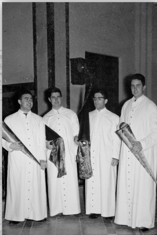
PRIMERA SALIDA 1963