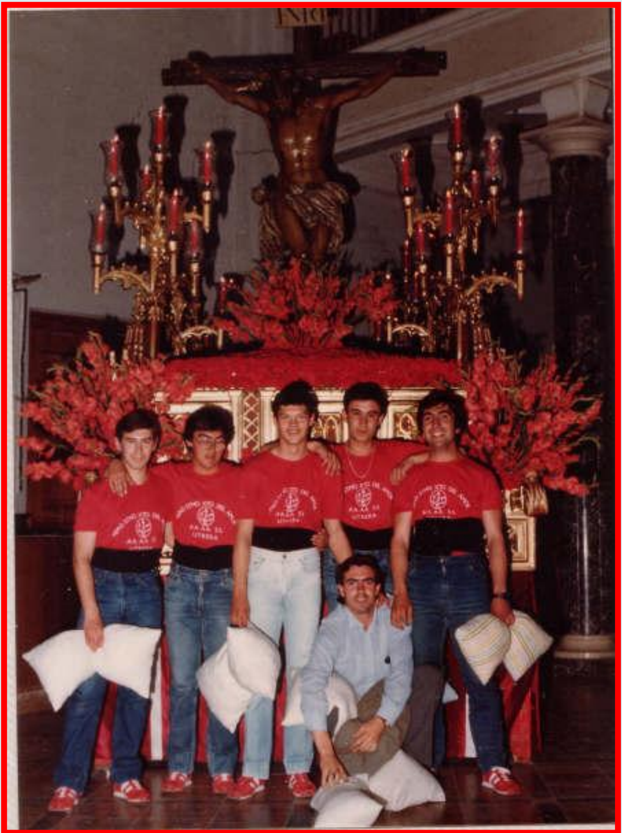
Los niños del Baloncesto CBU 1982